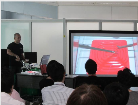
笠間先生の手技をプロジェクターに映し出しています。